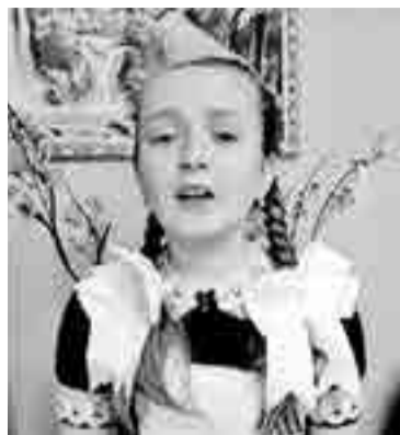
Скриншот видео youtube.com