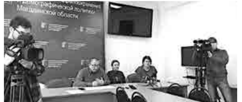
Через обследование в инфекционном госпитале прошли 36 пациентов, сейчас там находится 10 человек, в том числе лечение получает одна заболевшая COVID-19. У остальных результаты исследований отрицательные.

Главный внештатный инфекционист регионального минздрава рассказала, что на сегодняшний день инфекционный госпиталь