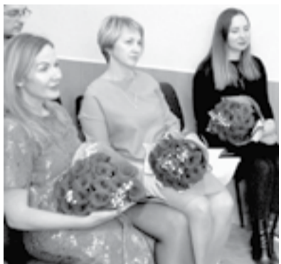
Их нацелили на защиту докторских диссертаций.

В рамках договора о научно-практическом сотрудничестве с областным Институтом развития образования и повышения квалификации педагогических кадров ученые «Арктики» выступили с лекциями «Особенности профессионального выгорания педагогов и способы коррекции», «Особенности развития детей в условиях Крайнего Севера», «Пути сохранения здоровья».