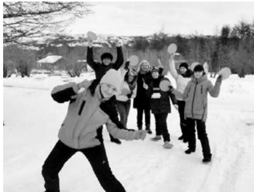
В новогодние каникулы лагерь готов принять 320 школьников.