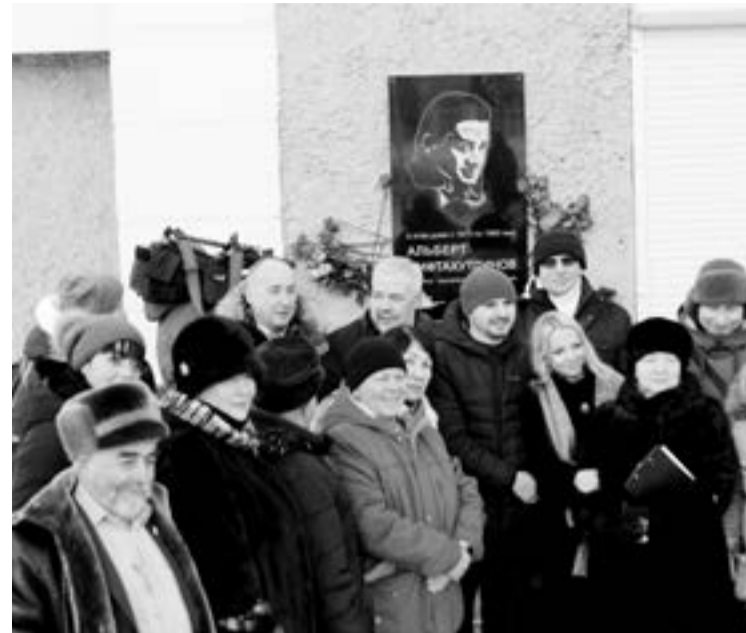
Проект мемориальной доски создан семьей дальневосточного советского прозаика.