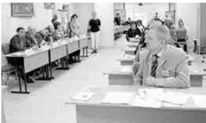
Подведение итогов и награждение победителей состоится в Правительстве Магаданской области в декабре 2019 года.