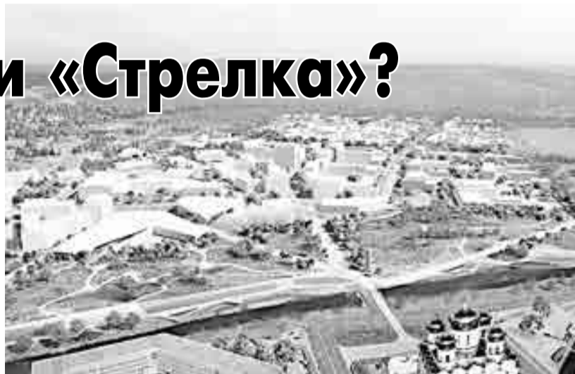
Проект жилой застройки Горохового поля. Фотослайды КБ «Стрелка».

Напомним, 15 ноября состоялось заседание архитектурно-градостроительного совета Магаданской области. На нем презентованы проекты региональных объектов социального назначения, предусмотренных в рамках комплексного освоения территории Горохового поля в Магадане.