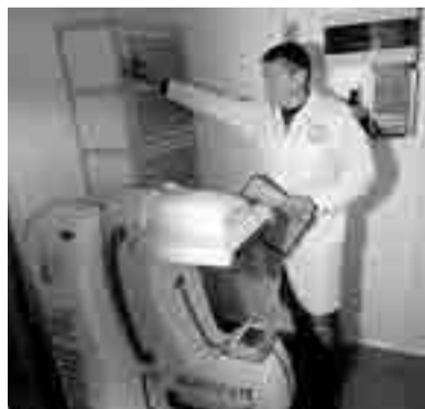
В последующем комплекс планируют дополнительно оснастить новейшим медицинским оборудованием.

На Колыме появился еще один медицинский КамАЗ, с медтехникой которого можно обеспечить выездную диспансеризацию населения