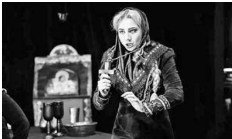
Опера Н. А. Римского-Корсакова «Боярыня Вера Шелога».

Основной целью Национальной оперной премии «Онегин» является объединение российского оперного сообщества. Премия учреждена в 2016 году автономной некоммерческой организацией «Центр поддержки культурных инициатив «Культура рядом» и вручается ежегодно по 9 конкурсному и 7 внеконкурсному номинациям.